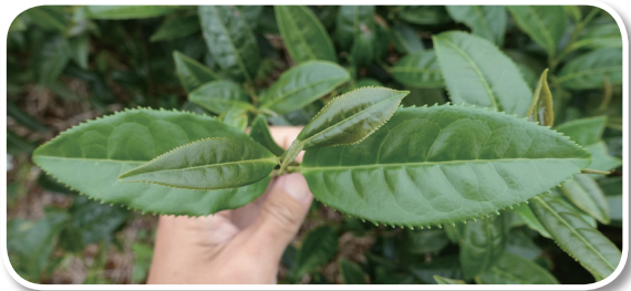
圖一、茶業改良場試驗品系保存圃之茶樹品系 2028 田間茶芽圖

相傳臺灣很多茶區（坪林、宜蘭、南投…等）種植茶樹品種「2028」，說明此品種樹勢強，產量高，製茶品質佳，又適合有機茶園種植，但農民指稱的「2028」到底是什麼？嚴格來說，「2028」應該稱為茶樹品系 2028，不能稱為茶樹品種，因品種是已命名的，而品系是未正式命名的，而茶樹品系 2028 應未在外流通推廣，但各茶區宣稱的「2028」到底是什麼？本篇文章將從育種譜系文獻、外表性狀及 DNA 分子鑑定綜合說明。