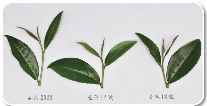
圖二、三個茶樹品種（系）之茶芽圖，由左而右分別為品系 2028、臺茶 12 號與臺茶 13 號

比較保存於茶業改良場試驗品系保存圃之三個品種（系）的芽葉（圖一、圖二及表二）：以芽色來說，品系 2028 及臺茶 13 號為綠帶紫，臺茶 12 號為綠帶黃（萌芽初期綠帶微紫）；以成葉葉色來說，品系 2028 及臺茶 13 號為綠，臺茶 12 號為淡綠；以葉形來看，品系 2028 為窄橢圓形（披針形），與臺茶 12 號及臺茶 13 號的中橢圓形（橢圓