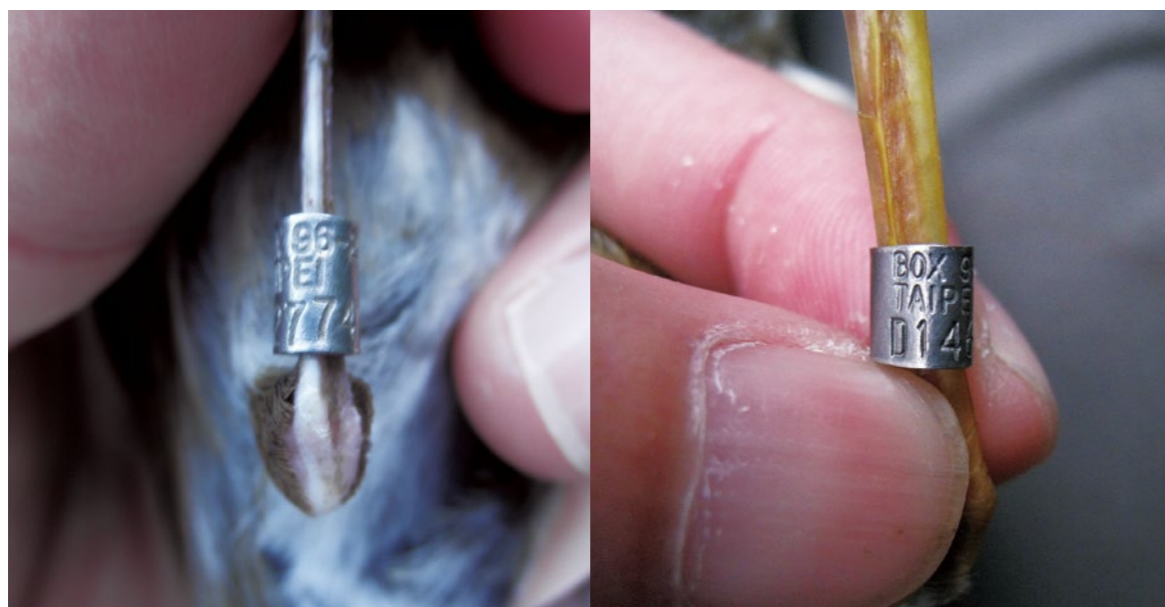
各種不同內徑編碼腳環與資料庫可以成為管理野鳥捕捉與買賣的工具。

考量盡量減少推動政策所需的人力，中央主管機關採公私協力方式，將腳環管理業務委託機關或團體協助進行。地方政府除接受申請獵捕與腳環申請外，主要為人工繁殖場的不定期查核。整體而言，強調相關業者自主管理，如人工繁殖紀錄須確實進行，同時也鼓勵消費者及關注保育人士協助監督市面販售野鳥或人工繁殖鳥是否都有腳環，有腳環者可進一步查詢開放的資料庫，比對資料的正確性。