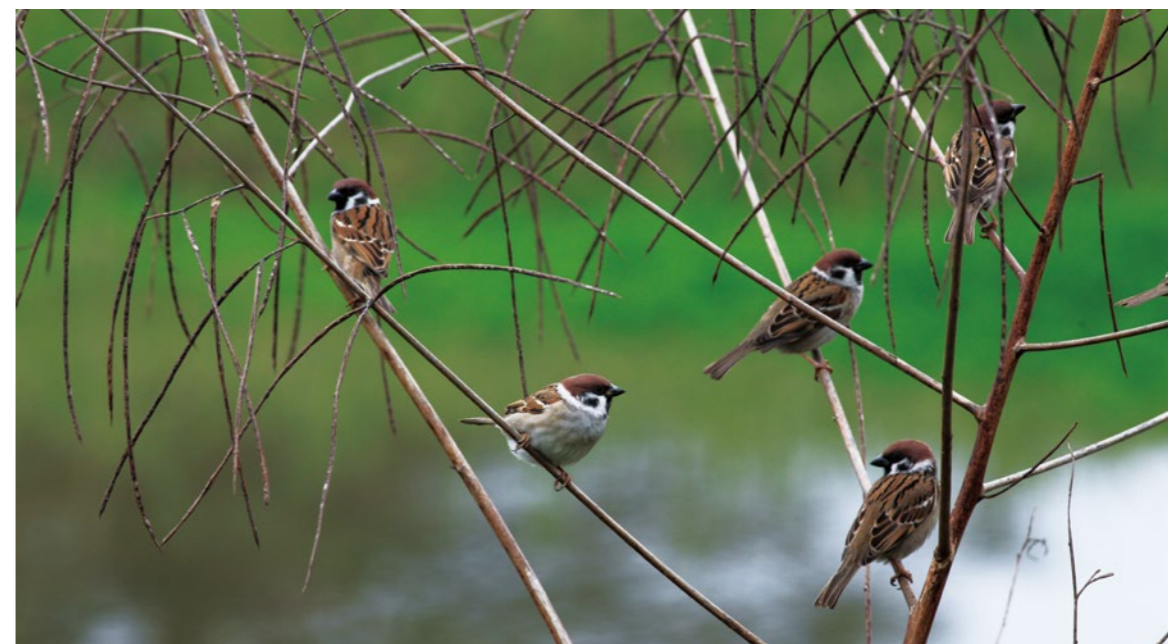
常見的麻雀經常成為被大量捕捉和放生的對象。

針對傳統上為狩獵對象的野鳥種類(game bird)，則另有專法管理。在國際貿易上，則遵守瀕臨絕種野生動植物國際貿易公約(又稱華盛頓公約，Convention on International Trade in Endangered Species of Wild Fauna and Flora，簡稱CITES)處理瀕危物種國際性交易相關規定。