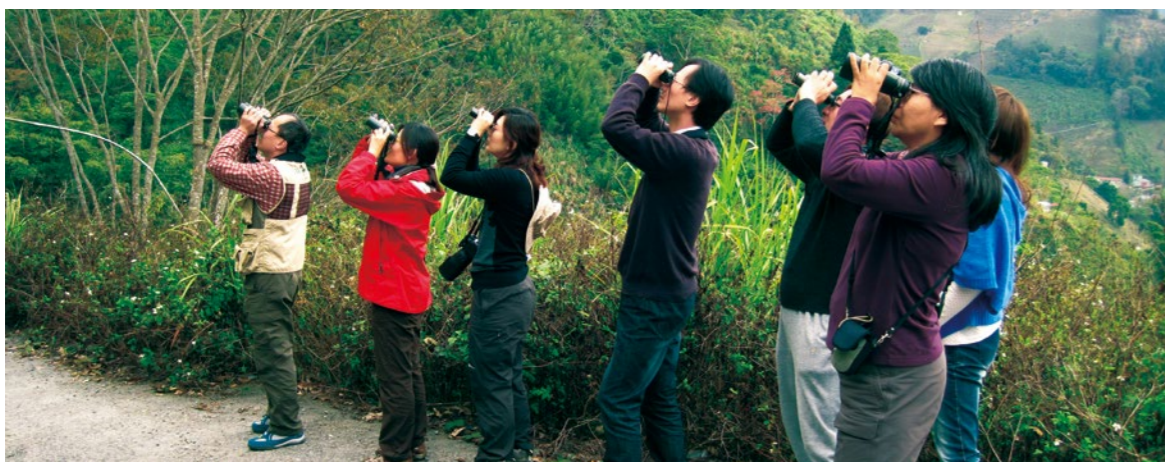
賞鳥是全球最普遍的自然觀察活動。

在臺灣養鳥同樣是非常普遍的休閒活動。就有限的鳥店野鳥調查數據顯示，在野生動物保育法(以下簡稱野動法)1989年開始實施及社會各界共同努力進行保育教育後，出現於鳥店中臺灣野鳥的種類與數量確有下降的趨勢，如祈偉廉等於1985-1992年間曾於臺中干城進行3個年度的鳥店野鳥調查，