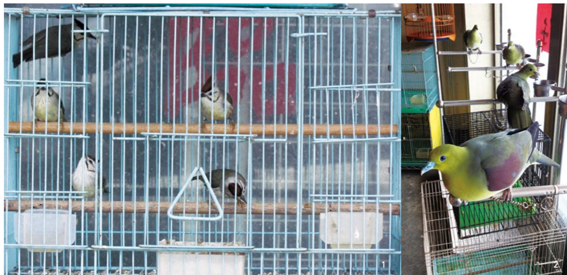
漂亮又美麗的特質也是野鳥成為寵物的主要原因。