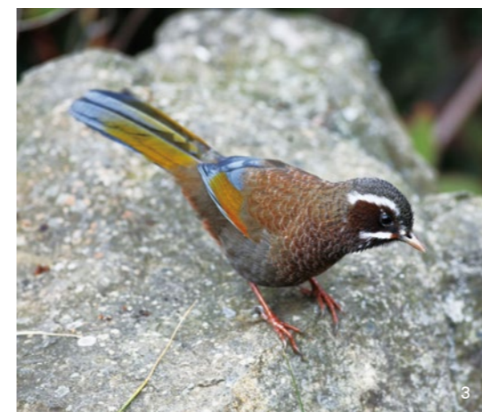
生活於高海拔的臺灣噪眉在鳥店也不難見到。

野鳥是重要且可持續的生物多樣性資源，加上關注者眾，妥適的經營管理是必須的。在對野鳥的態度或價值判斷是多元的，但保育優先，兼容可持續的利用應是不同利害關係人對野鳥利用最大公約數。由於文化及宗教因素，臺灣短期之內對於野鳥的市場需求勢必持續存在。在此前提下，除了改以人工繁殖提供市場需求(Jepson and Ladle 2005)，鼓勵與野生動物救傷結合的護生來取代放生，以降低對生物多樣性的衝擊外，更應將野鳥視為共有資源積極管理，以使野鳥捕捉不至於影響族群存續，同時不會衍生物種不當移動與外來種擴散等副作用。