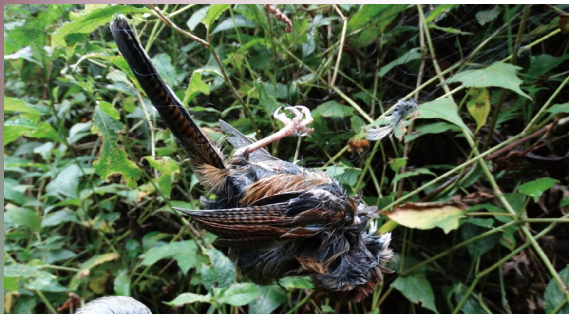
野外違法捕捉野鳥不易管理且經常造成大量傷亡。

本文就臺灣野鳥捕捉與販賣管理現況與面臨問題進行探討，同時針對行政院農業委員會於2013年10月31日預告修正之「營利性野生動物飼養繁殖管理辦法」相關內容，提出以腳環協助管理之建議及可能做法，期能對於落實臺灣野鳥捕捉與買賣管理有正面助益。