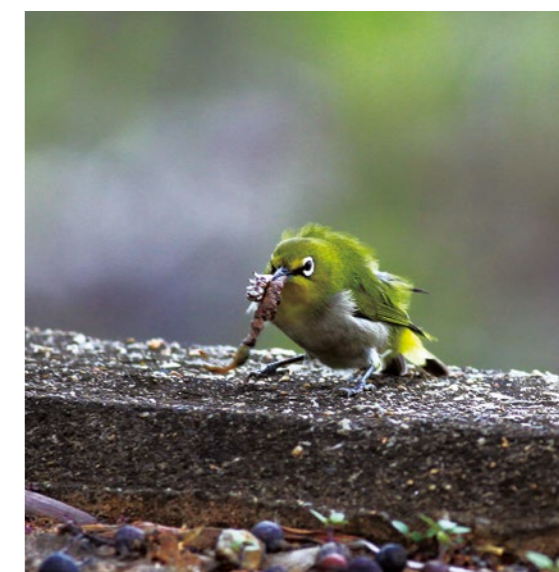
綠繡眼是目前鳥店最常見的野鳥之一。

就買賣野鳥的合法來源來看，其管理上主要的困難在於野鳥自野外被捕捉開始及之後過程的管理，如此過程若未能妥適管理，則無法追蹤確實遭捕捉的物種、數量及其地點與時間，所謂合法就成了形式上的許可。