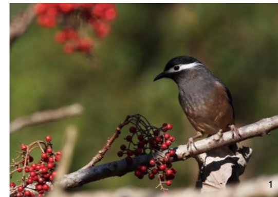
可愛的白耳畫眉在鳥店也經常可見。