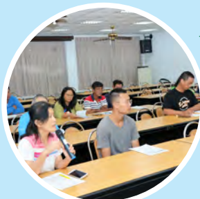
◀ 擬申請業主於說明會提問「印尼青農來臺實習計畫」申辦資格及來臺住宿等相關細節