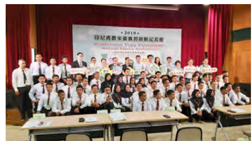
◀ 今年第一梯 印尼青農53 名抵臺記者 會合影