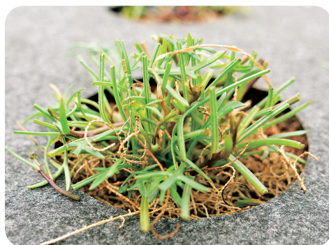
圖4. 香茹採收地上部時，未收穫部位宜留存少數葉片