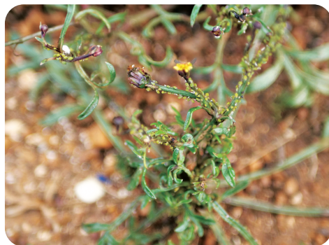
圖3. 蚜蟲危害香茹葉部而致皺縮變形

傳統上香茹相關產品以整株植物做為原物料，並無區分地上部與地下部，然而據澎湖當地製茶業者的經驗，茶香主要來自地上部，且義守大學洪哲穎教授團隊發現香茹地上部的機能性成分(木犀草素)含量較高，其抗氧化能力亦比地下部強，故發展香茹連續性栽培技術應可符合原物料需求。除此之外，本栽培技術主要有以下3項優點：(1)減少成本支出：可有效減少育苗與定植次數，而降低人力與材料等費用；(2)增加年產量：每一期作之間無空窗期，且生長期縮短至2個月，1年可採收4~5次；(3)分級利用原物料：為配合香茹保健產業的發展，不同植株部位與生長期有不同的機能性成分與功效，藉由本技術可取得特定原物料。