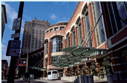
2019昆蟲年會在聖路易市美國會議中心舉辦