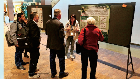
本場研究人員多項發表展現我國農業昆蟲研發實力