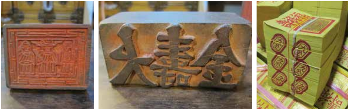
左圖與中圖為宗教用紙所使用木刻版畫，會刻上多種神明圖案，並在成疊竹紙側邊蓋上不同圖案或文字的紅印，以示區別

煮兩種，蒸煮法必須經過半個月以上與石灰與草木灰的反覆蒸煮，相當耗費人力，通常用於製做高品質的竹漿；而沒有經過蒸煮程序的竹子只用石灰水浸泡堆置而自然發酵，這種製法會存有較多的木質素，所以多用在製作原色或品質較低的紙張，如衛生紙、包裝紙等。不需蒸煮的製紙法操作簡單，耗用材料只有石灰，生產成本低，相當適合作為農村的副業進行持續的生產。綠色竹子在經過浸泡及蒸煮，當葉綠素被破壞後，竹漿便呈現天然的黃棕色，也就是我們一般所見紙錢的顏色。