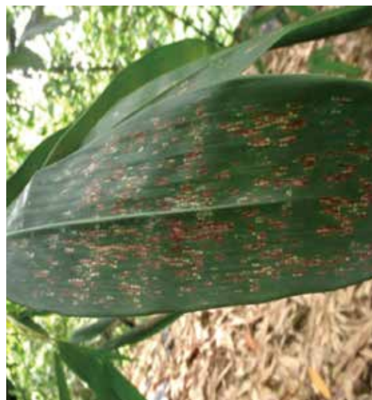
麻竹感染竹嵌紋病毒之葉病徵