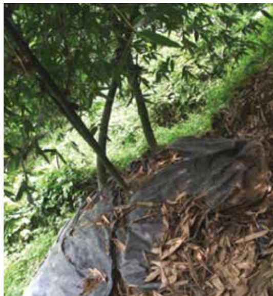
可藉由目測判識二次，篩選健康母竹叢(王仁 攝)

將對照組(純化的病毒樣品)與接受檢測母竹叢的麻竹葉汁液(未知的受檢樣本)，固定在96孔盤，再加入含有抗體的抗血清，與病毒接