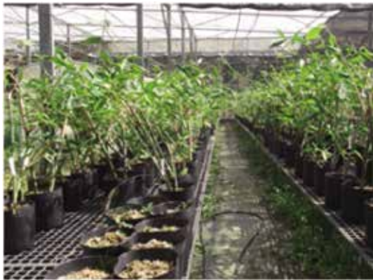
採苗繁殖圃採光通風良好，且竹苗皆須編號

繁殖圃，即可申請供苗。符合規定之健康麻竹母竹叢園，此後每半年做1次間接ELISA篩檢，如發現罹病竹株須立及剷除，否則將耗費更大成本，重新建立園區，如此即可建立健康麻竹苗生產及檢測體系。