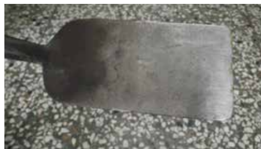
臺中大坑地區竹農採筍使用工具

的病蟲害，分別為白絹病( Athelia rolfsii )、竹嵌紋病( Bamboo mosaic virus, BaMV )、銹病( Dasturelle divina )、煤病( Scorias communis )、竹葉扁蚜( Astegopteryx bambusifoliae )、盲椿象( Mecistoscelis scirtetoides )、粗腳飛蝨( Purohita cervina )等。其中，竹嵌紋病為病毒引起，潛伏期有時很長，初期難由外觀斷定母株竹叢