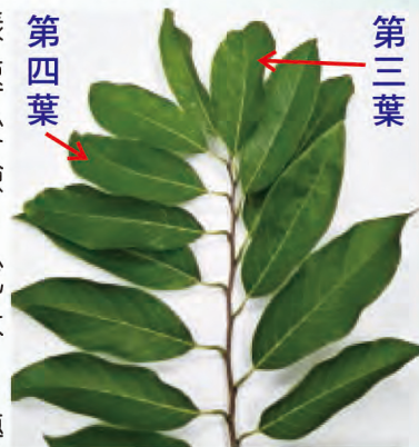
採非結果枝第三或四葉

詢問採集方式或檢驗報告，可逕洽本場土壤肥料研究室，電話089-325110轉720或722。