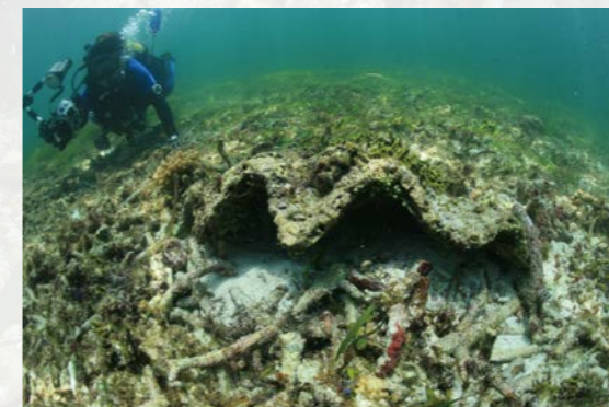
東沙島的巨碑磔貝空殼。