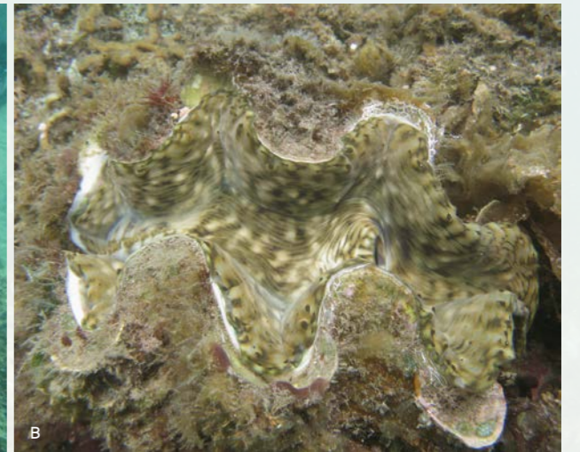
外套膜花紋不同的鱗碑磔貝。(A)墾丁；(B)綠島。