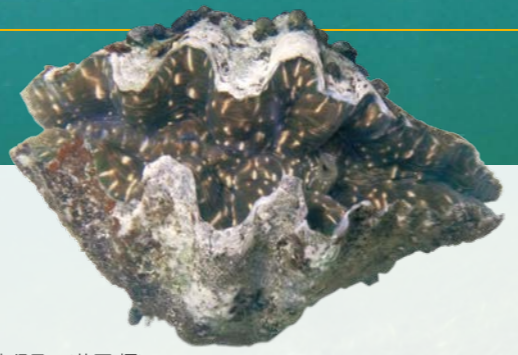
東沙島的菱碑磔貝。

(唐澄清 2005; Kubo and Iwai 2007)。可惜的是，臺灣和日本的研究沒有留下任何可供比對的碑磔貝樣本，所以後繼困難。無獨有偶，澳洲昆士蘭大學的研究團隊於2013年也在西澳看到長碑磔貝的這個隱藏種(Huelsken et al. 2013)；隔年，筆者也利用基因定序和形態特徵，確認並發表這隱藏種就是諾亞碑磔貝(Su et al. 2014)。