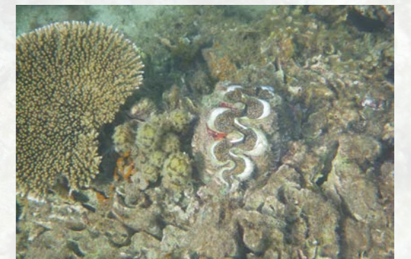
墾丁的諾亞碑磔貝。