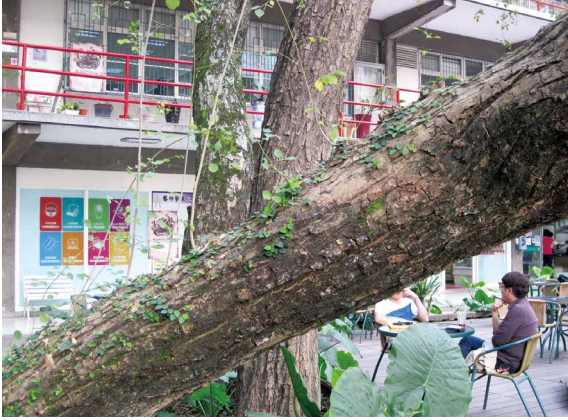
無板根供支撐的印度黃檀，株幹易因本身重量而歪斜，樹皮上亦有龜裂狀。

手工藝品、裝飾品以及扇骨、念珠、箱匣等物品等市面上炙手可熱的珍貨，常是以檀香樹材為原料而製成。