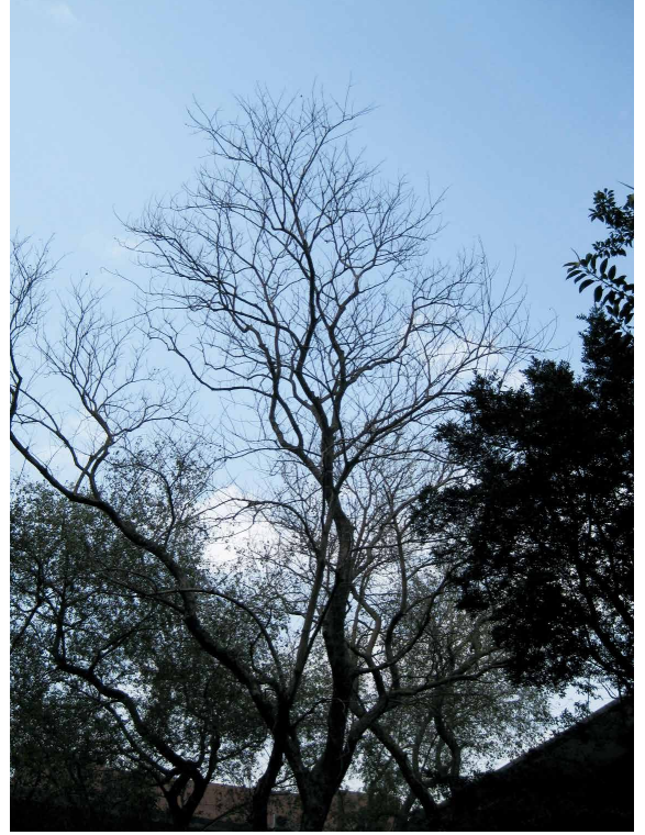
印度紫檀在寒冬時，樹葉掉落的光禿景象。

蝶狀的黃色兩性花於盛綻時花數極多，金黃色澤的花兒有梗，瓣、萼俱為5枚，花冠挺出於花萼外，兩枚旗瓣為圓形或闊卵形，花形左右對稱並組成頂生或腋生的總狀花序，且會散發出清香的氣味；雄蕊10枚、花藥丁字著生，雌蕊子房上位；花期約落於4-5月，因為每株紫檀的花期十分短暫，自施綻芳華至成熟落瓣不過短暫的數日，倏即使得花兒瓣片掉落樹下滿地，形成片片的黃色花毯，因而若欲賞覽其花必須特別留意綻花時段，方不致於失之交臂。