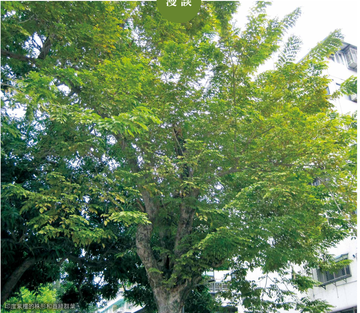
印度紫檀的株形和盛綠群葉。