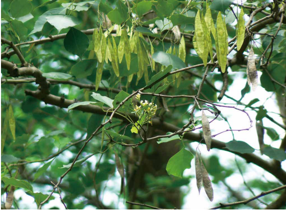
印度黃檀於秋後結出的果莢。