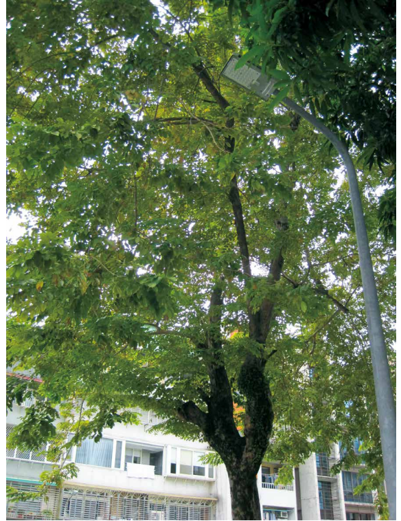
印度紫檀的株形和盎綠群葉。

上述豆科（Fabaceae）之內的蝶形花亞科（Papilionoideae）植物，所綻放的花卉具有明顯特徵，並且擁有廣大的群體，它的5枚花瓣特化成1枚旗瓣、2枚翼瓣和經常合生於一起的2枚龍骨瓣，這5枚花瓣組成宛如蝴蝶一般的形狀，色彩上更是變化萬千。而豆科當中，則依據同科植物內花瓣的排列、花朵對稱性和花序形態，又可區分出蝶形花亞科、蘇木亞科和含羞草亞科等數個亞科；不過，另有學派則跳脫傳統之方式，逕將蝶形花、蘇木和含羞草3個亞科，歸列為獨自成科的「蝶形花科」