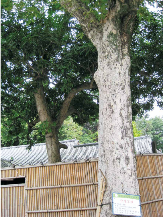
印度紫檀之樹皮會呈現剝裂狀。