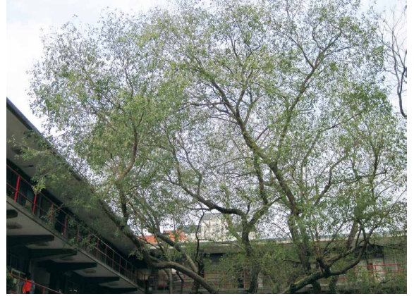
印度黃檀的高聳傘狀樹形。

荒禿的情形，而在天氣長期晴朗的南部，印度黃檀倒像是整年皆有密葉留存於枝頭上，得以發揮恆常遮陽的功效。