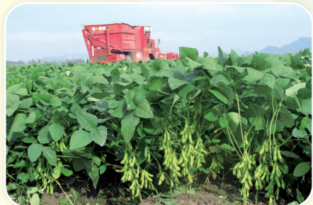
利用機械化及智慧化精準生產，提升毛豆產業競爭力。