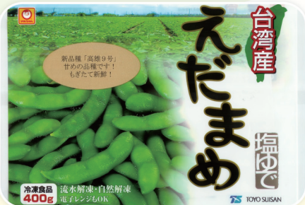
臺灣冷凍毛豆產品優質安全，受消費者喜愛。