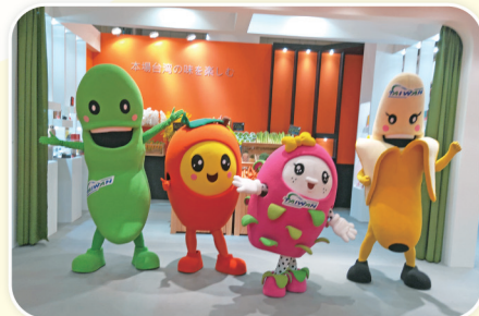
農委會輔導業者參加東京國際食品展辦理臺灣毛豆品嘗及行銷，拓展外銷。