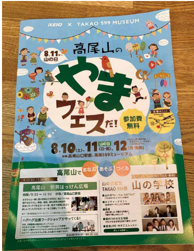
圖4、里山生活嘉年華DM正面。