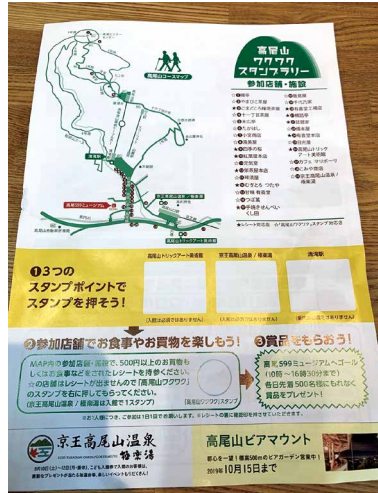
圖5、里山活動嘉年華DM反面。