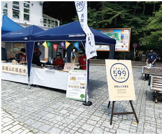
圖10、高尾山應援金協議會展示攤位。