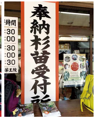
圖15、杉苗奉納申請處。

山林的維持，民眾除可藉由奉納捐獻祈求好運降臨、願望實現外，同時亦為山林投入一份實質的心力，而奉納達萬元日圓以上，捐獻者姓名將會列入芳名錄公開致謝。經觀察，本年度山之日連續假期期間，來訪藥王院民眾人數較一般平日多，非佛教信徒亦願意排隊捐獻杉苗奉納金。