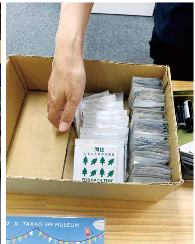
圖9、國產材運用：檜木泡澡片。

結合地方商家，至指定地點集章並於合作商家消費後，即可至TAKAO 599博物館換取山之日活動紀念品（TAKAO 599博物館或檜木泡澡片（圖9）一份。活動不僅可引導遊客深入瞭解高尾山的自然景點，亦為地方商家帶來商機。