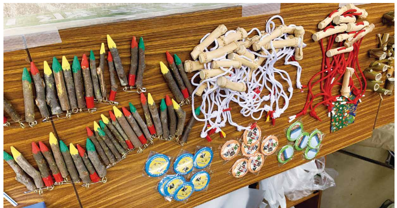
圖19、活動參與紀念品。

的惠益，實現珍愛森林，將森林環境與價值永續保存下去的願景。從訂定山之日，到舉辦相關活動，日本政府以「發起」山之日、「營造」環境教育氛圍、「體驗」木育五感、「推廣」森林價值四步驟為本，將木育概念以活動方式，深植於人民心中。🌲