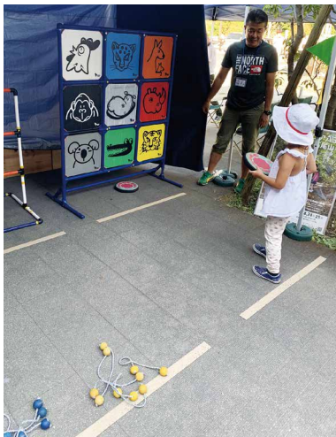
圖7、生態知識遊戲體驗。