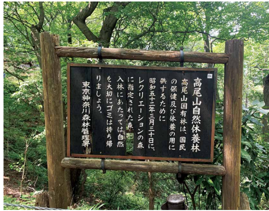
圖1、高尾山森林屬性說明。

高尾山（日語讀音：Takao Yama）位於日本東京都八王子市，標高為599公尺，因位於暖帶林與溫帶林交界處，富有1,300種以上的植物、100種以上的野鳥，以及5,000種以上昆蟲，四季生態相當豐富，1967年被指定為明治之森高尾國定公園。其距離市中心新宿約不到一個小時車程即可直達，交通便利，因此為