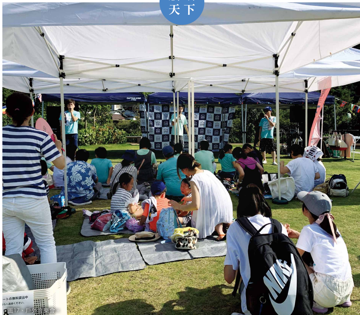
トの無料貸出中 から退却ください。 圖17、戶外音樂會