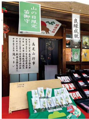
圖14、高尾山山之日限定御守。