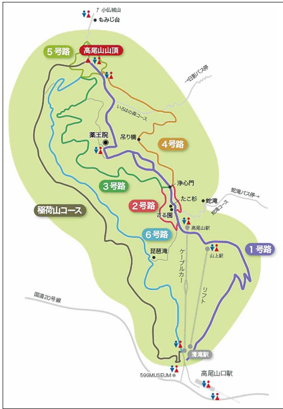
圖3、高尾山自然研究路線。