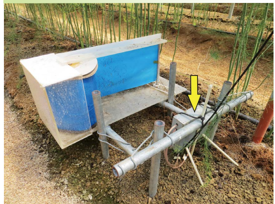
8 薊馬影像拍攝系統(黃色箭頭處為攝影機)