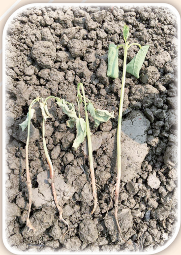
感染根腐病的紅豆苗株