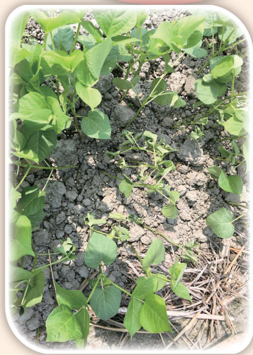
紅豆田區根腐病發病造成缺株

高屏地區紅豆已陸續播種，但部分地區因熱對流而易有午後陣雨，如果土壤含水量高，易導致植株罹染根腐病，因此本場籲請栽種紅豆的農友特別注意此一病害發生，即時防治，以遏止病害蔓延，減少損失。