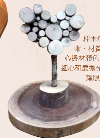
榉木年輪清晰、材質緻密及心邊材顏色分明，經細心研磨拋光後可得耀眼作品。