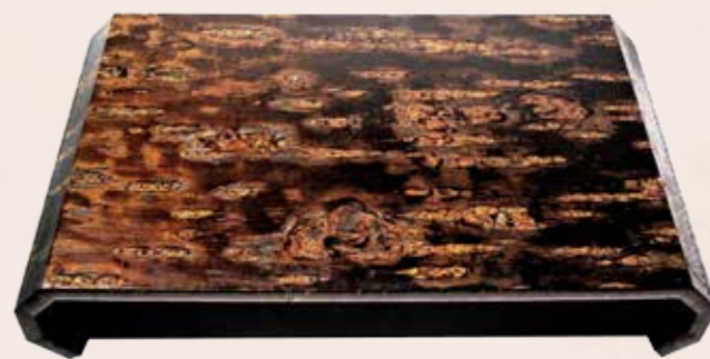
櫻花樹皮所製成的展示檯呈現華麗金屬光澤