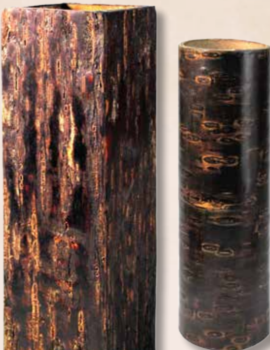
肯氏南洋杉樹皮所製成花器