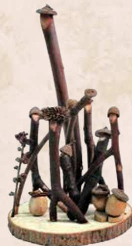
運用質感差異的枝條搭配各式殼斗科果實組成的全家福創作