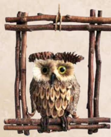
小枝條組成活靈活現的貓頭鷹飾品