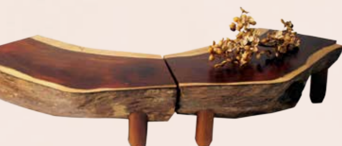
欣賞作品對稱性、心邊材材色差異及高貴的心材顏色的墨水樹展示檯。