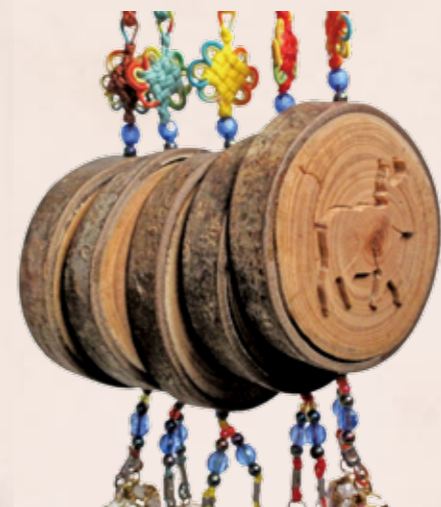
年輪清晰的榉木運用線雕技巧所作的十二生肖浮雕吊飾