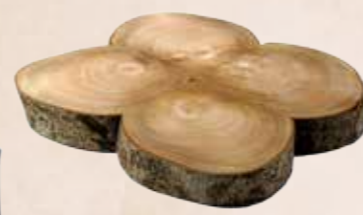
光蠟樹桌墊呈現內斂的木材紋飾及細緻的木材質感