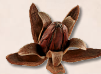
大葉桃花心木藝品