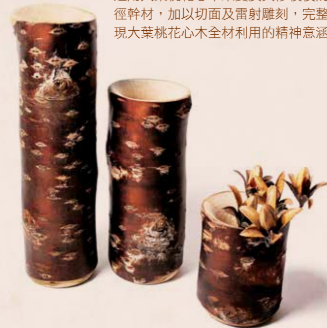
應用山櫻花小徑木所型塑的花器組