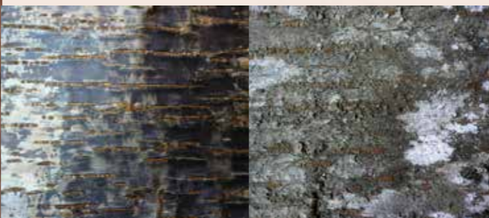
山櫻花樹皮剝取後樹皮內側(左)、外層(右)