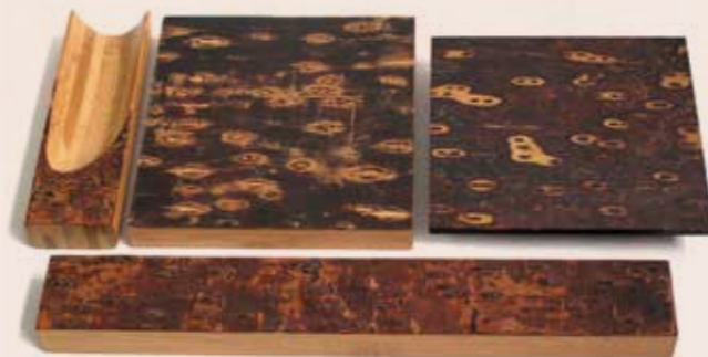
應用肯氏南洋杉樹皮所製得的各式生活用品