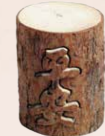
樟樹經線雕加工後，創作出整合年輪紋飾、樹皮質感及特殊香氣的吉祥藝品。