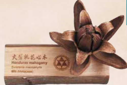
運用大葉桃花心木果實及其修枝後的小徑幹材，加以切面及雷射雕刻，完整呈現大葉桃花心木全材利用的精神意涵。