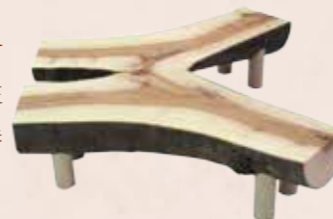
彎曲的榉木段木可以開發出具對稱性及心邊材木色差異的展示檯