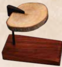
賞玩由粗木質線構成特殊華麗線條的山龍眼藝品