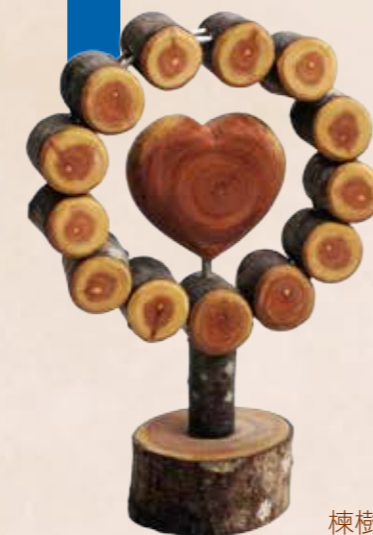
棟樹年輪清晰、木肌細緻、樹皮縱裂及邊心材顏色差異等多項特色可以創作出各式藝品。