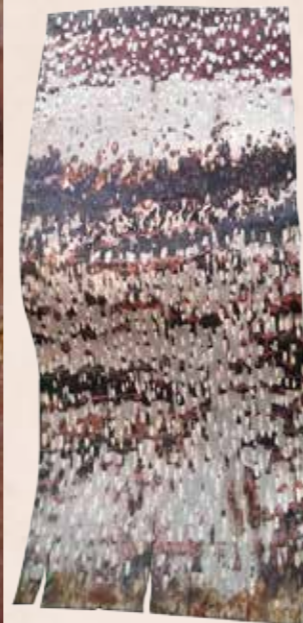
肯氏南洋杉樹皮剝取後樹皮內側(左)、外層(右)

經研究後，目前發現只有山櫻花和肯氏南洋杉的外皮層容易剝取，且不會妨礙樹木生長，因此我們在夏季生長旺盛時節，內外皮層間的樹液豐沛之際，取下外皮層壓平加工，製作成各種華麗的樹藝品。