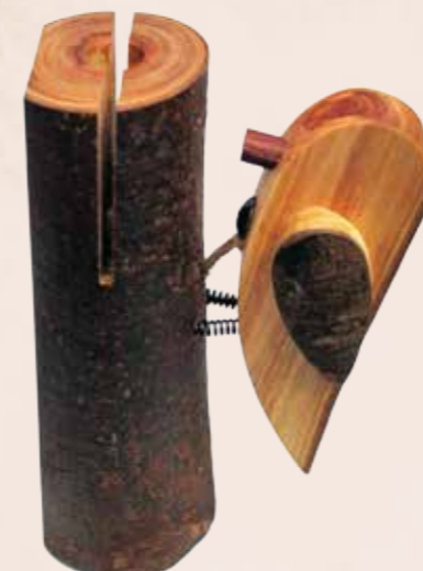
榉木材質緻密堅韌，吊鈴發揮結實清脆的音質。