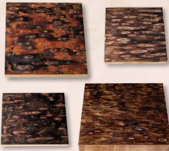
肯氏南洋杉多層次的樹皮可以變化出許多種質感