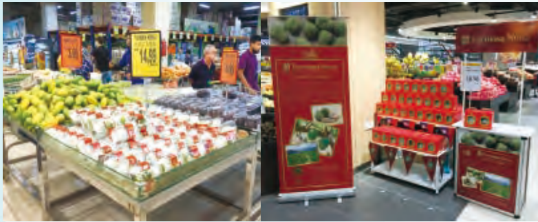
圖5.臺灣鳳梨釋迦於馬來西亞吉隆坡NSK(左)及Aeon(右)超市單果包裝販售情形

67%)，表皮易失水褐化，造成外觀賣相不佳；而且臺灣鳳梨釋迦對消費者屬於新奇水果，會有好奇拿起觀看情形，為減少直接觸碰造成碰傷，因此鳳梨釋迦鮮果不建議裸果販售；所以通路商會提供塑膠盒或紙盒給超市進行單果包裝販售(圖5)，但是要注意包裝材料通氣性。因為超市時販售人員普遍不了解鳳梨釋迦特性，果實到超市時會進入超市倉儲等待上架或貯存，但是超市倉儲溫度過低(0-2°C)，易造成果實寒害；也有觀察到低溫倉儲後，於室內環境陳列時，包裝盒上有水氣產生(圖6)。