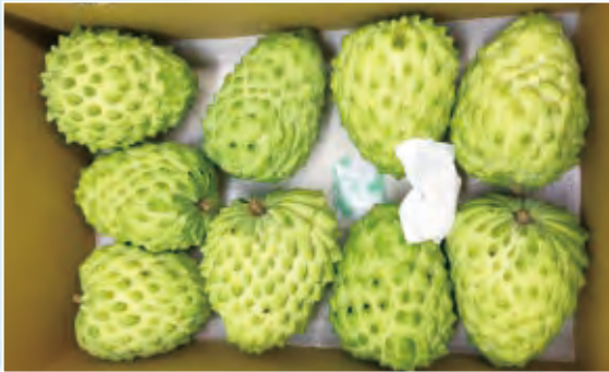
圖3.106年保鮮劑處理之果實海運至吉隆坡之外觀情形