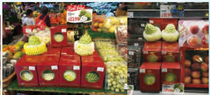
圖7.馬來西亞吉隆坡de Market超市室內(左)及冷藏架(右)上販售情形