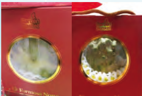
圖6.鳳梨釋迦包裝盒上有水氣附著

臺灣鳳梨釋迦外銷馬來西亞貯運方式，建議為產地集貨及陸運至港口2天加上船運時間7天及海關1-2天(計10-11天)，貨櫃溫度設定為8°C，貨櫃進到達馬來西亞後可立即上市銷售，因此鳳梨釋迦以船運至馬來西亞銷售原則上可行。超市銷售可先在室溫上架一天後再移置冷藏(10-12°C)架上販售。鳳梨釋迦糖度高果肉Q，符合馬來西亞消費者對甜度高水果之喜好，但通路商反應果品耗損高，不利於銷售，本場持續調整保鮮技術，期能降低果品耗損，才能有助於持續開拓馬來西亞高端消費市場。