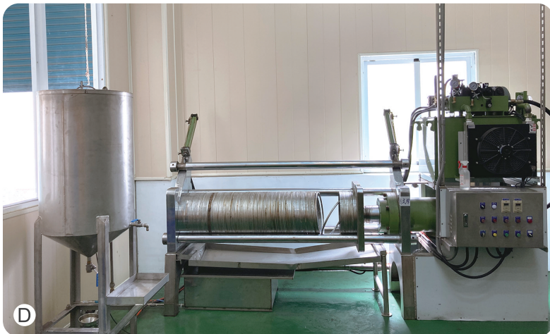
圖3. 恆春鎮農會的胡麻加工設備 (A) 入料及焙炒 (B) 碾碎及蒸煮 (C) 定形及壓實 (D) 壓榨及分裝