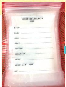
1 取採樣袋 (一個樣品配一個採樣袋)