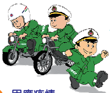
4 因應疫情 請將採樣袋裝盒/箱 郵寄至本場