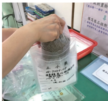
3 將樣品放入採樣袋中 一個樣品配一個採樣袋，請記得密封喔！