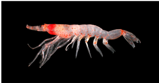
Fig. 1 The morphology of Sergia lucens

覆泥底質，而東港與宜蘭灣的櫻花蝦漁場條件亦與之相似，主要差別在臺灣的櫻花蝦漁場為開放性海域，而日本的駿河灣則為封閉型的舟狀盆地(陳與蘇, 1993)。