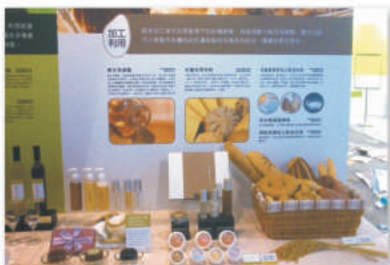
▲以米原料開發彩妝保養品及米麵包。

本場在本次規劃的有機展區中，展示水稻田中放養鴨子之共棲栽作方式，以鴨子不食禾本科植物之雜食特性，清除雜草並啄食害蟲、福壽螺等，同時其排泄物可作為水稻之養分來源，生產的稻米品質優異，鴨子也在自然環境下成長，其肉質鮮美厚實，大幅增加了農民收益；果園中則放養家禽，提供