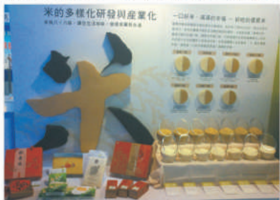
▲優質好米育成與米包裝禮盒之設計。

「有機農業團隊一有機~好吃又好玩」展區中，展示各試驗改良場所近年有機農業的研究與推廣成果。有機農林漁牧綜合經營，展示有機農園放養家禽及魚類防治福壽螺等有害動物及雜草，放養動物之排泄物可供農園中作物所需的養分，同時魚類及家禽育成後亦可販售，增加農民收益。有機種子種苗技術研發，展示冬瓜、小胡瓜、青江菜及小白菜等各種蔬菜之有機採種技術，以及利用高嶺土、麥飯石及珍珠石粉等材料研發有機種衣劑技術，並可添加微生物及植物萃