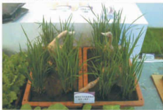
▲有機水稻田間除蟲除草的好幫手—合鴨。