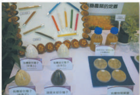
▲有機種子披衣處理、有機液肥及有機物降解菌之開發。