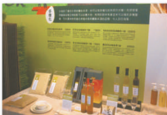
▲以米原料開發之養生醋、養生酒及玄米茶等。