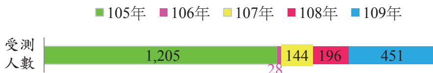
圖一、105-109 年初級能力鑑定受測人數