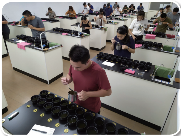
圖三、(左)初級-茶類辨識(茶湯)，(右)中級-茶葉(茶湯)拼對測驗。