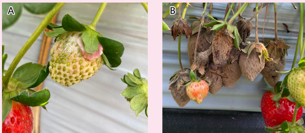
圖五、草莓果實常見病害：A. 白粉病；B. 灰黴病。

草莓除了食味優良，其營養成份如維生素 C、多酚化合物及花青素等抗氧化成分含量也優於多種水果，部分歐美國家以提升此類抗氧化成分為育種改良方向，期望增加機能性用途。國內草莓品種特性的改良，可從植株型態、生長習性及果實品質做多方面提升，以強化產業量能、增進農民收益、同時顧及民眾健康。