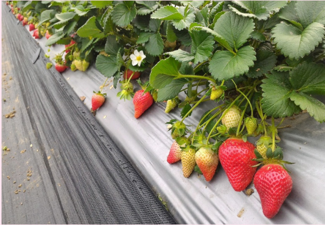
圖二、苗粟 1 號戀香品種單梗結果特性。

通的豐香品種，經留苗繁殖已有長柄及短柄 2 種類型，長柄豐香多於獅潭一帶栽培，大湖地區栽培則多為短柄豐香。