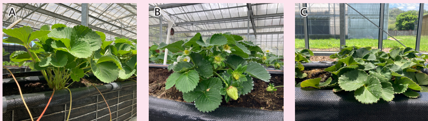
圖一、草莓 3 種植株型態：A. 直立型植株；B. 半直立型植株；C. 開張型植株。

果梗長短則影響果實採收及果實品質，果梗短易導致果實受植株葉片遮蓋，缺乏光照而果實光澤不足，並且不易採收，而果實亦容易因接觸畦面或栽培介質，於接觸面形成爛果，故短梗品種栽培常配合生長調節劑的使用，以增加果梗長度。苗栗產區多年流