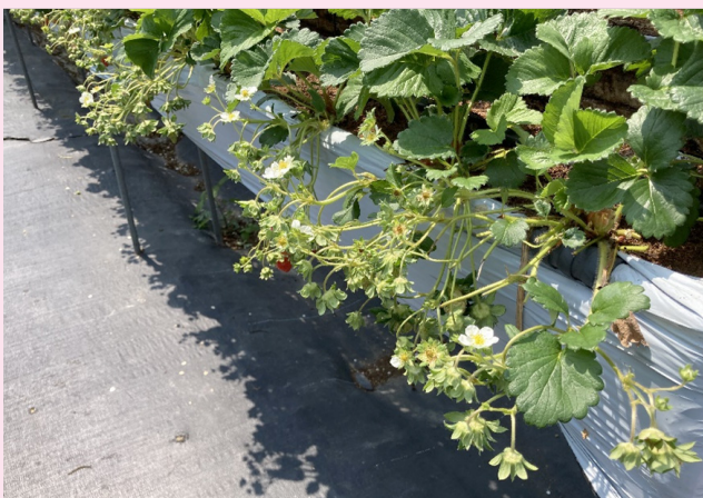
圖三、豐香品種果梗為分岔型態。