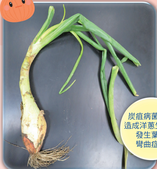
炭疽病菌可能造成洋蔥生育期發生葉鞘彎曲症狀