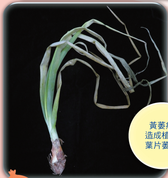
黃萎病造成植株葉片萎凋