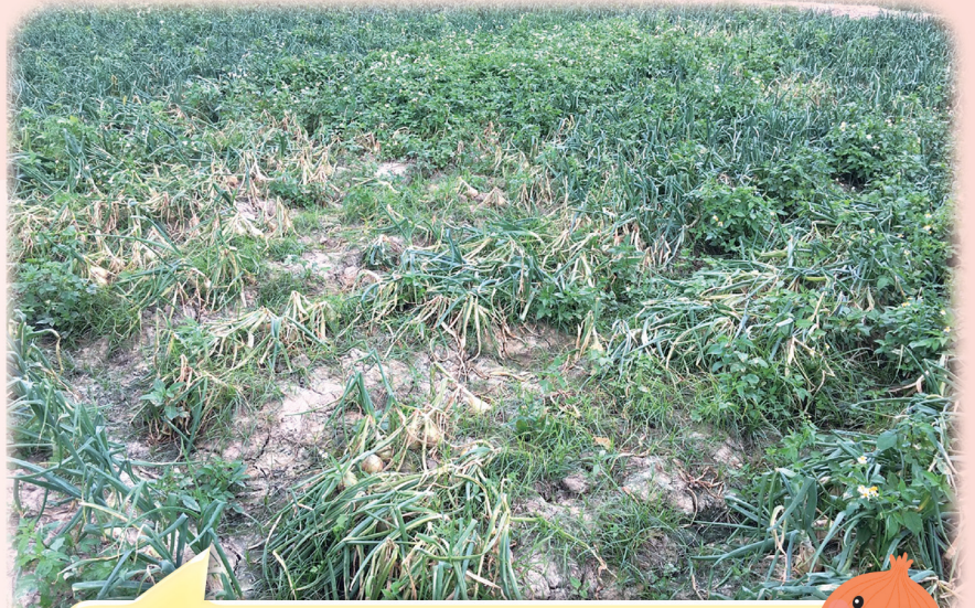
洋蔥感染炭疽病造成葉片褐化萎凋，植株乾枯。