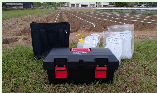
圖一、攜帶式 pH 及電導度檢測計由於體積小，搭配其他耗材可集中於手提工具箱內增加機動性。

在正規的實驗流程中，當土壤樣品與水混合後，須靜置 60 分鐘以待其溶液平衡穩定後才測定 pH 值。為加快現地速測，筆者測試了靜置時間對攜帶式 pH 值的讀值變化（表一），顯示混合液靜置 30 分鐘即可至穩定狀態，此可縮短正規檢測 50% 的時間花費。