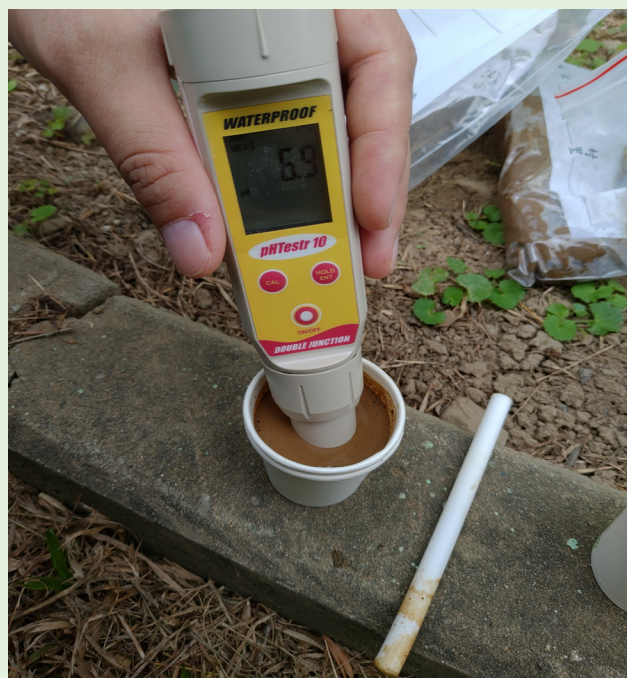
圖二、攜帶式 pH 及電導度檢測計於實際測定時應將電極沒入溶液中。