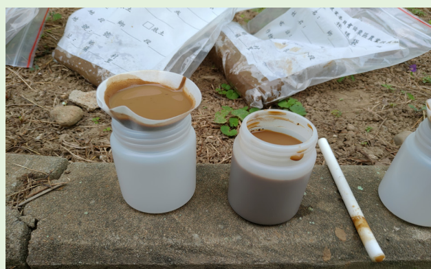
圖三、土壤樣品溶液於測定電導度之前應先過濾。