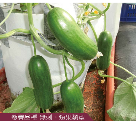
參賽品種-無刺、短果類型