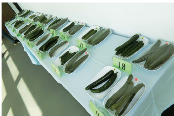
圖五、參賽品種於果實品評後剩餘果於會場外展示