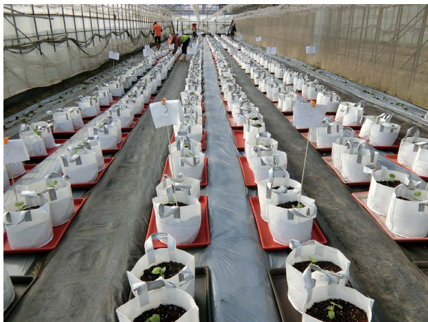
圖二、於100坪簡易溫室，規劃以介質袋種植比賽植株(定植當日)

以本場簡易溫室既有空間(100坪)可容納之最多株數進行育苗與田間規劃。各品種於2021年10月20日以50格穴盤、泥炭土播種育苗，10月30日調查發芽率，所有參賽品種發芽率皆高於90%。田區設計採2重複、每重複12株，單行植，行距1.2公尺、株距45公分。第1重複順序排列，第2重複逢機排列，四週種植保護