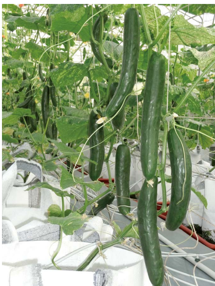
圖四、比賽植株以滴灌（滴箭；右下方）給養液