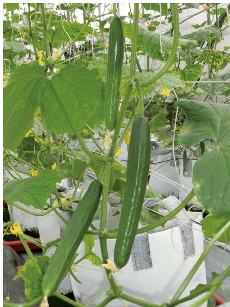
圖八、亞軍-農友種苗公司EX-3218品種之植株樣態與結果情形