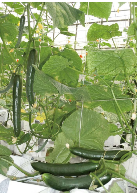
圖七、冠軍-豐田種苗行NO.184品種植株樣態與結果情形