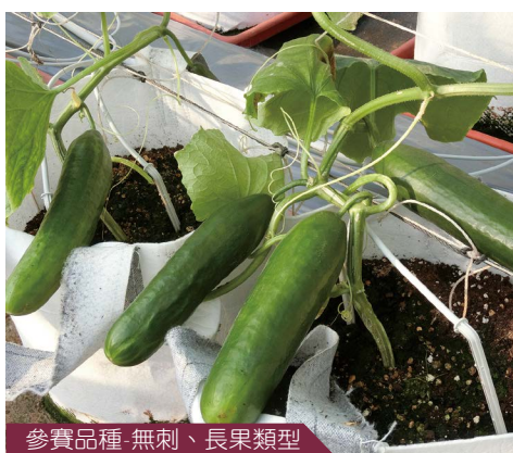
參賽品種-無刺、長果類型