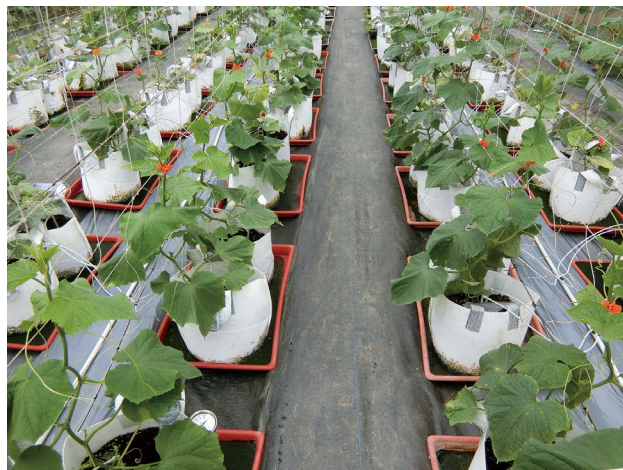
圖三、定植後第22日，植株進入快速生長階段