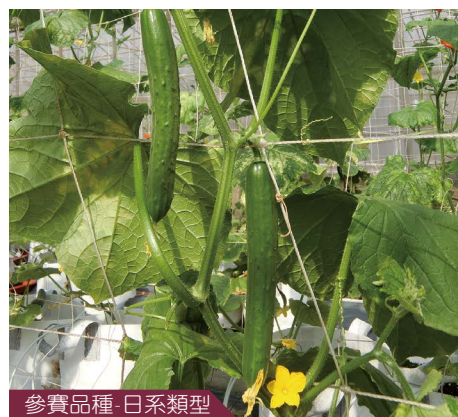
參賽品種-日系類型