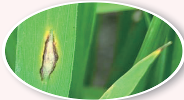
水稻葉稻熱病病斑