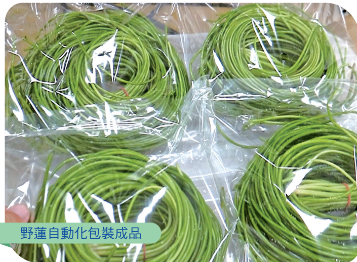
野蓮自動化包裝成品