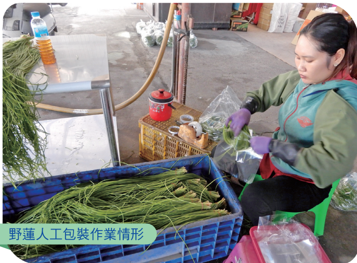
野蓮人工包裝作業情形