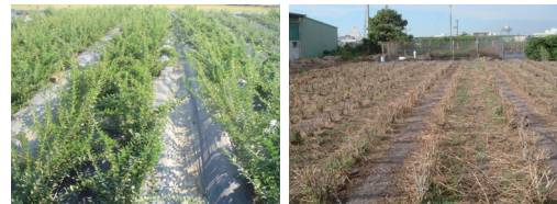
圖二、葉用枸杞田間生長(左)與修剪情形(右)