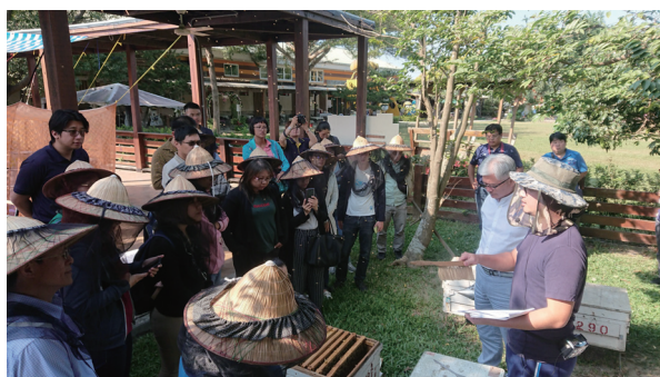
圖二、驗證單位稽核員參加蜂蜜 TGAP 講習