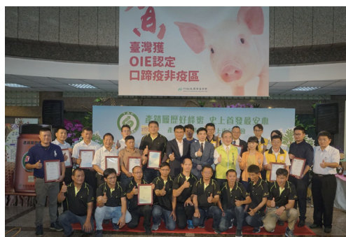
圖三、14 戶蜂產品經營業者取得蜂蜜產銷履歷證書