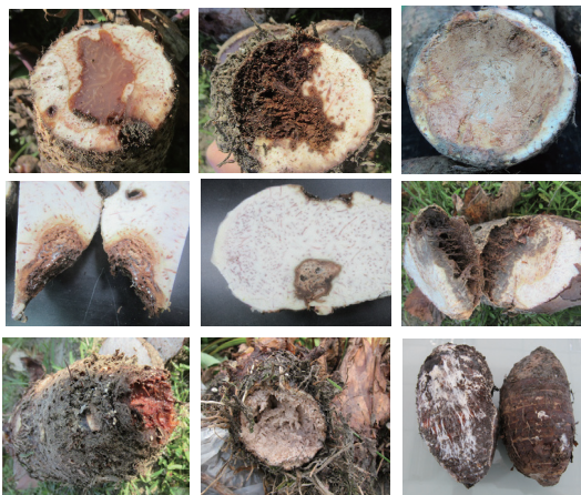
圖一、芋球莖軟腐病徵呈現多種樣貌且難以分辨為細菌性或真菌性病原。

近來球莖軟腐病發生嚴重且病徵呈現多種樣貌，採自田間之病株及病土經病原微生物分離與鑑定，發現有 2 種真菌與 2 種細菌可造成芋軟腐病，真菌分別為 Neocosmospora solani 及白絹病菌 ( Sclerotium rolfsii )；細菌為 Dickeya fangzhongdai 及 Pectobacterium sp.，由病徵難以分辨為細菌或真菌危害，致採取妥適防治策略更顯不易。芋球莖軟腐病除白絹病菌 ( Sclerotium rolfsii ) 外尚無有效推薦用藥，因此，防範重於治療，利用事前的種苗及土壤病原檢測、健康種苗、輪作作物、土壤消毒及水分管理等綜合栽培管理策略以降低病害風險，並進而改善農藥施用造成的食安問題及環境生態威脅，以利產業永續發展。