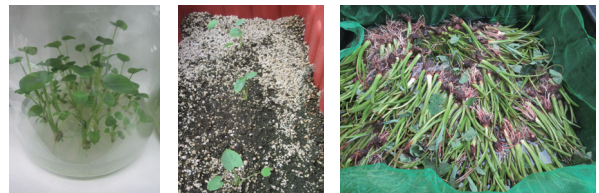
圖三、利用組織培養及種苗消毒取得健康種苗。