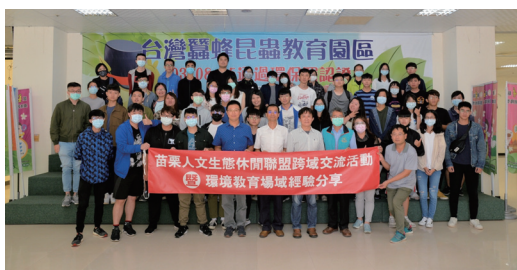
圖一、109 年苗栗縣環境教育場域交流暨經驗分享活動後於苗栗場照相舞台前合影

以百年農業踏實精神為基礎，熱心奉獻用心環教的衝勁為動力，本場所屬「臺灣蠶蜂昆蟲教育園區」，於 103 年 8 月 5 日通過行政院環境保護署環境教育設施場域認證；成為全國第 90 家、苗栗縣第 5 家環境教育設施場所，亦為行政院農業委員會所屬 7 個區農業改良場中，首度通過該認證之試驗研究機關，為結合農業科技研發與環境教育推廣之優質環教場所。起草催生夥伴結盟加入「苗栗人文生態休閒聯盟」，以跨區域、跨部會、跨領域為發展軸心，本場域與客家委員會 - 臺灣客家文化館、雪霸國家公園管理處、行政院農業委員會水土保持局臺中分局、交通部觀光局參山國家公園管理處、國立聯合大學及苗栗縣政府，共同合作，進行廣域性及異質性之跨域整合，配合苗栗縣政府辦理環境教育嘉年華、客委會客家文化發展中心 - 山路彎彎及遶山樂特展活動與客家挑擔成長禮... 等跨域活動，落實結盟結合在地社區及食農教育活動，帶動在地發展、環境永續經營與資源共享，期能擴大環境教育推廣宣傳效益及影響力。