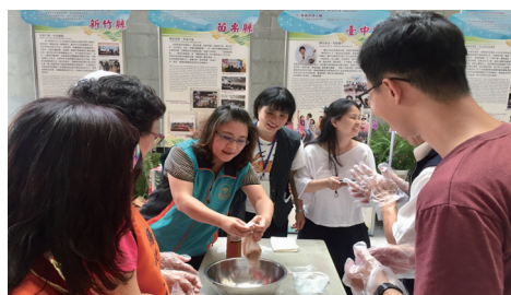
圖二、本場環境教育團隊配合農委會政風廉潔紮根教育暨環境教育宣導 - 進行愛玉 DIY 搓搓樂活動