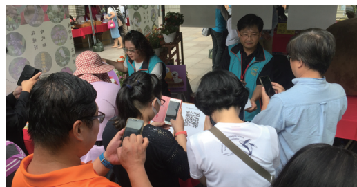
圖三、環教配合養蜂協會 50 周年慶活動 (台中科博館)