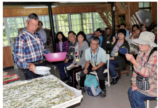
圖二、食農教育講座上課情形