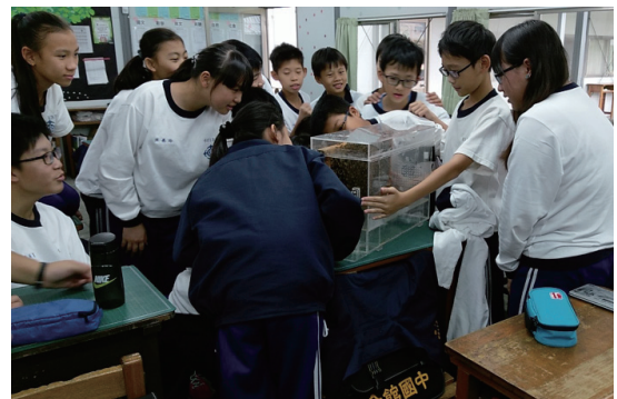
圖四、蜜蜂生態觀察