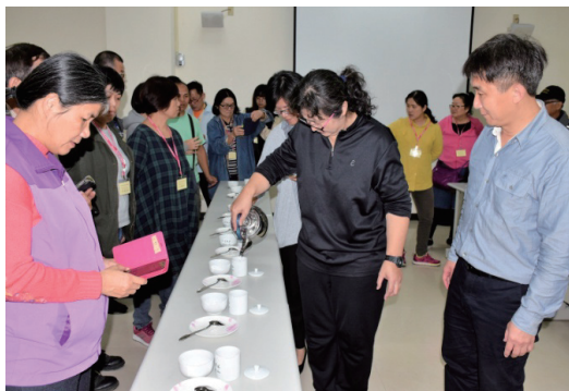
圖三、桑葉茶品評介紹