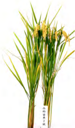
圖三、苗栗 2 號植株外觀