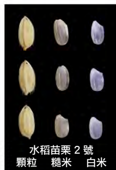
圖四、苗栗 2 號具禾質軟 Q 特性