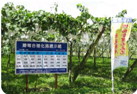
圖三、葡萄合理化施肥田間示範區