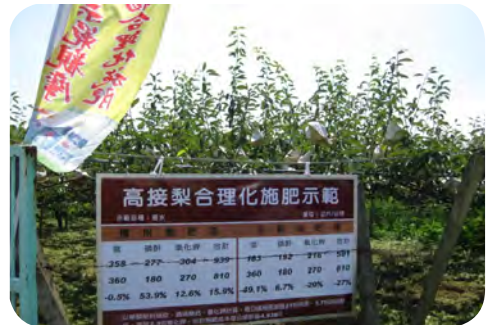
圖二、高接梨合理化施肥田間示範區