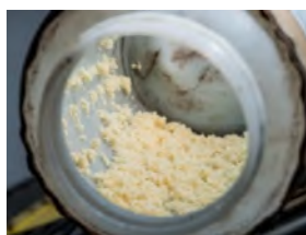
東方果實蠅卵收集器