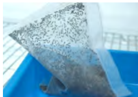
利用網袋於田間釋放蛹寄生蜂