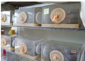
蛹寄生蜂室內大量繁殖