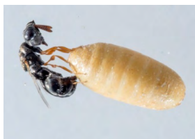
格氏突闊小蜂寄生東方果實蠅的蛹