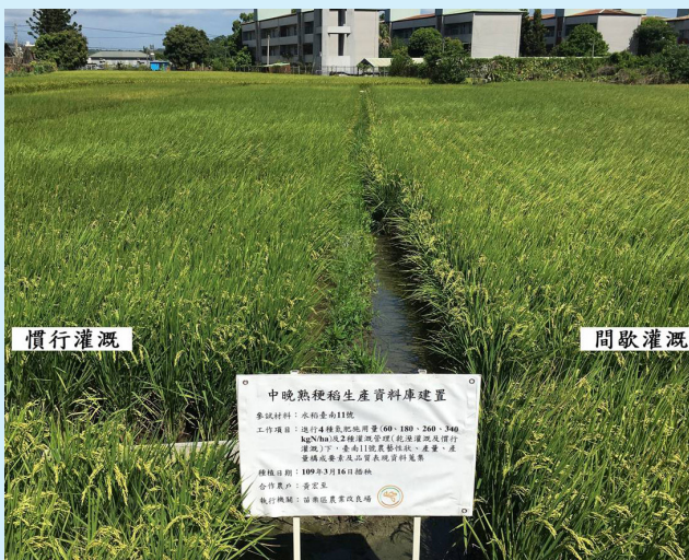
圖一、臺南 11 號間歇灌溉 (右) 及慣行灌溉 (左) 間田間生育情形無顯著差異。

本場自 108 年起與國立中興大學、農業試驗所及臺中區農業改良場合作進行水稻間歇灌溉技術調整及驗證，目前已於苗栗、臺中及彰化等地完成臺南 11 號、臺農 71 號及臺中秈 10 號之測試，試驗結果均顯示間歇灌溉技術不會造成產量損失，且可減少灌溉勞力及成本，可作為農友栽培之參考。