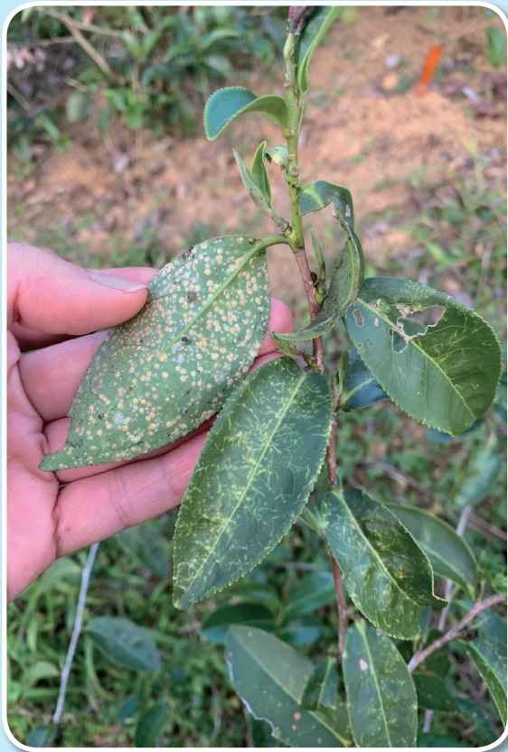
圖二、淡薄圓盾介殼蟲主要寄生在茶樹成熟葉片之葉背。