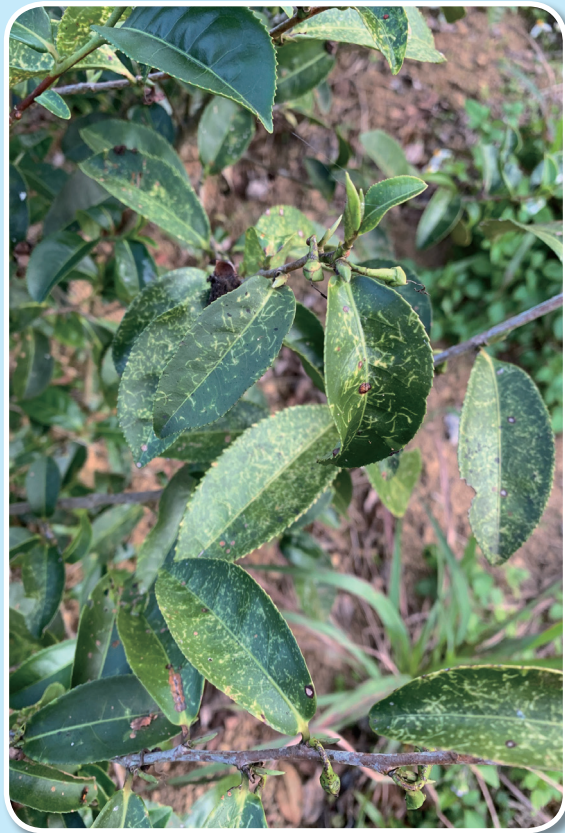
圖三、茶葉受淡薄圓盾介殼蟲危害後，葉表呈黃色斑點狀。