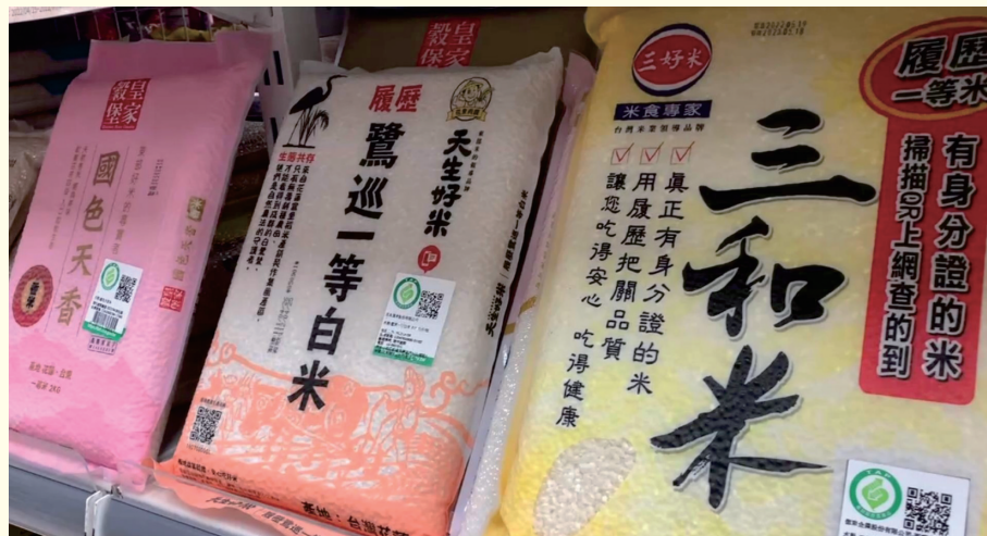
產銷履歷驗證小包裝米販售情形