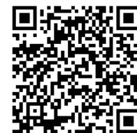
水稻產銷履歷報你知

為讓民衆輕鬆瞭解苗栗地區水稻產銷履歷推廣現況及展望，本場製作了「水稻產銷履歷報你知」影片，可從下方QR code掃描進入，進一步瞭解相關水稻產銷履歷驗證成果及申辦方法。