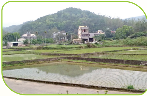
從事有機友善耕作應慎選地點水源

臺灣有很多的從農資源值得農友們多利用，除了中央與地方政府單位外，各個試驗所、改良場、植物教學醫院等，還有被派駐在農會或公所裡的儲備植物醫師，相當歡迎農民朋友過來找我們交流討論。