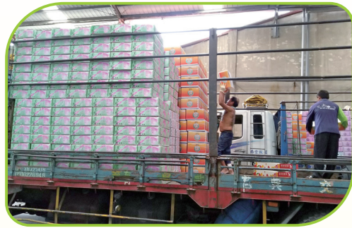
從事有機友善耕作應詳細規劃之後的銷售通路