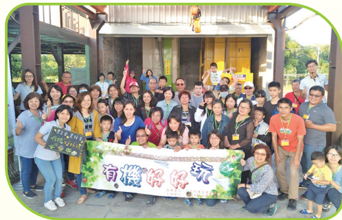
有機友善耕作的觀念心態需要持續推廣紮根