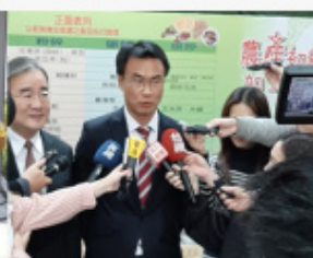
陳主委說明初級加工政策