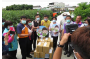
縣長蒞臨推廣彰化優鮮農產