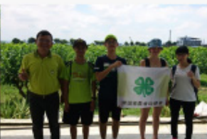
積極推動國際農業技術交流