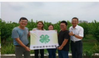
彰化青農與泰國草根大使交流