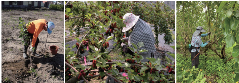
圖、桑椹栽培重點管理工作