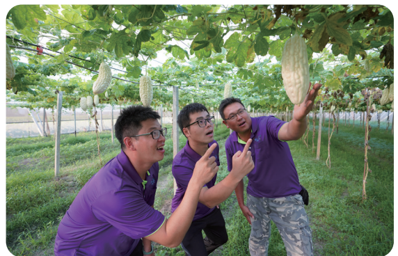
團隊的每一位成員皆生產不同品項的安全農作物，滿足通路商的需求