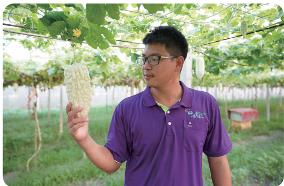
做為團隊隊長的平安，負責團隊與通路洽談，並制定年生產計畫