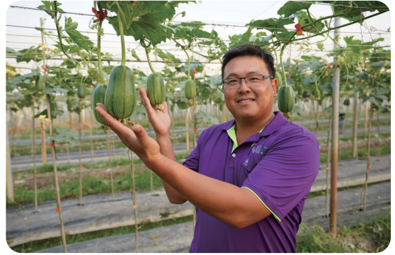
慶賢在團隊中負責網室搭建評估與維修等設施問題