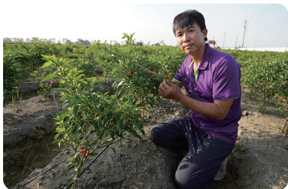
啓仲在團隊負責農業防治資材的團購與洽談，並執行產銷履歷驗證