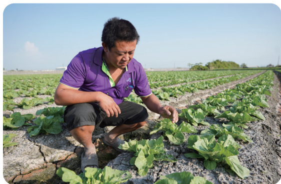
明鎮在團隊中負責田間管理與田間工人的安排