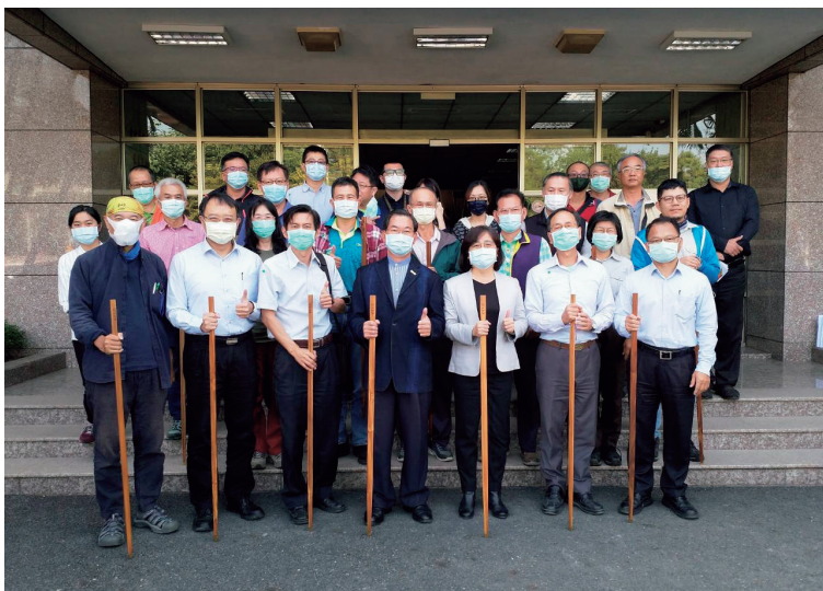
山海圳國家綠道跨部門推動平臺第4次會議

2020年12月10日更於甫落成啟用的台江文化中心，舉辦一場名為「串接過去與未來，走一條山海之路」的發表會，13個山海圳平臺夥伴模擬由海到山的溯源路程，接棒插旗，共同宣示推動全線177公里的路線串連工作。隔年2021年4月世界地球日後一連3天各平臺成員更以跳點接力方式完成山海圳綠道全線精華走讀，以此再次凝聚跨部會共同守護山海圳的共識與情感。