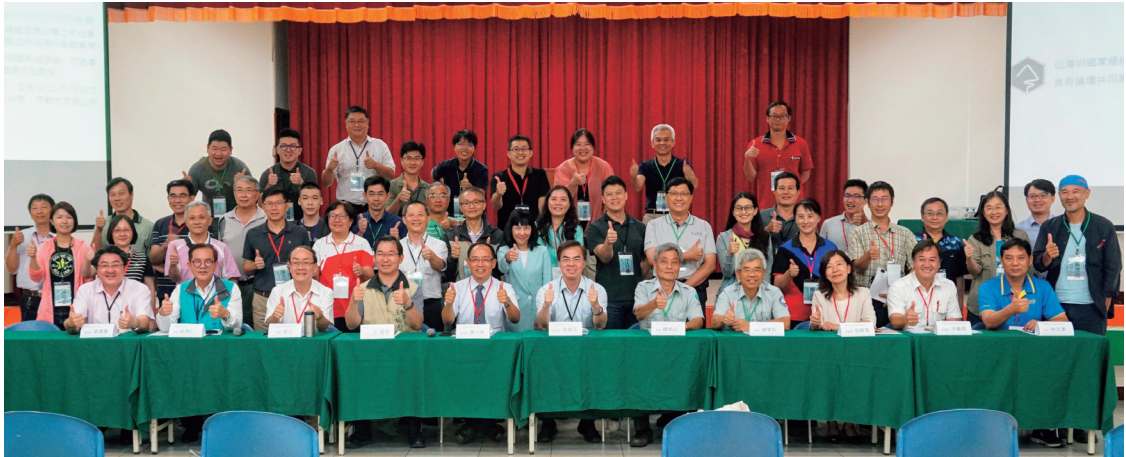
跨部門共識營

道，其中1條主題軸線即為民間已在地推動近10年的山海圳綠道。自此，臺南山海圳綠道，正式從單一縣市層級，提升為國家級綠道，並由農委會（林務局）擔任主辦部會，「負責整合相關部會及地方政府，擬定推動計畫，經費部分則由各目的事業主管機關依其現行施政計畫，配合本綱要計畫之策略、措施及目標，提出其施政計畫內容作為本綱要計畫之實施計畫，循預算程序辦理。不足部分，請國發會匡列公共建設經費挹注。」（行政院「建構國家級綠道網絡綱要計畫」會議紀錄，2018）