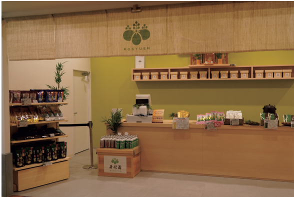
獨特商店—幸修園茶商