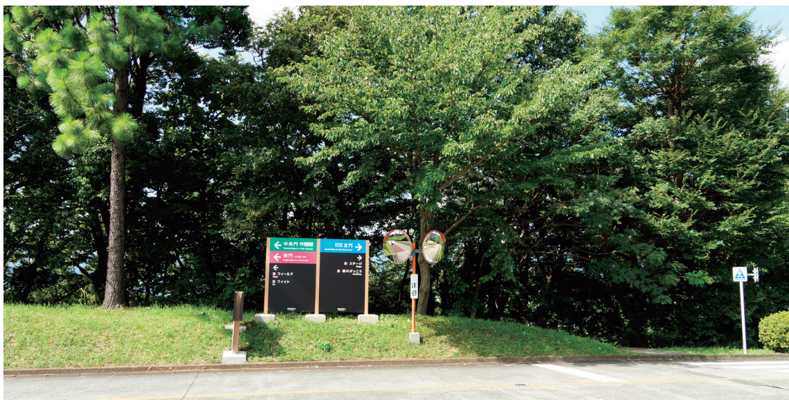
大井町的森林療癒步道入口

反觀日本透過森林療癒的發展，搭配森林環境的完善規劃，融入地方特色的行程，以及讓遊客感受森林的生命力，達到恢復身心健康的狀態，並進一步振興地方產業發展。其中，神奈川縣大井町之森林療癒基地，係以結合民間企業為代表案例，通過日本第13屆森林療法學會的認證，也是該縣第一個取得森林療癒步道認證的鄉鎮（Me-Byo Valley，2018），成為該鎮推動地方產業振興與農業人口回流的主