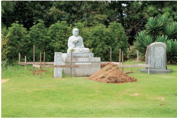
弘法大師雕像與石碑（施工中）