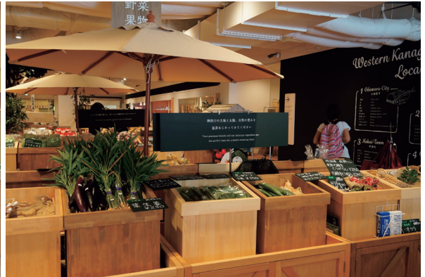
當地時令的蔬菜和產品

後，為了培養居民的地方認同感，還在當地博物館畫廊展示，以及保存著先民使用農業工具的照片，透過適當保護、管理和利用，作為重要的文化財產資源。