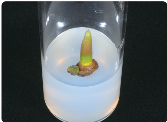
圖2. 紅寶石竹芋初代培養的芽體生長情形