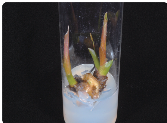
圖5. 大孔雀竹芋分蘖側芽生長成側芽株

表面，並注意栽培期間的管理，確保側芽免於土壤及灌溉水污染，可大幅降低培植體的汙染率，並減少培植體因消毒所造成的褐化問題。隨後，將經前處理栽培一段時間的竹芋莖段，逐層剝除包覆於莖段上的組織，使頂芽和側芽裸露，並以自來水洗淨後，利用0.5%次氯酸鈉 (NaOCl) 溶液加2滴/100ml展著劑Tween-20，超音波振盪15分鐘進行表面消毒，再以無菌水沖洗後，切取帶頂芽或側芽的莖節組織並修整受滅菌劑傷害的部分後做為培植體使用，用以誘導芽體生長及分蘖側芽增殖。培養基組成以MS基礎培養基為主，另添加其他有機物及蔗糖，並以洋菜作為固體凝膠劑。培養環境溫度為 25 \pm 2^{\circ}\text{C} 。