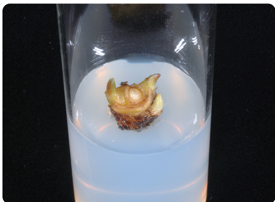
圖4. 大孔雀竹芋去頂培養誘導短縮莖形成分蘖側芽增殖