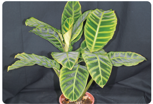
圖1. 竹芋的種類眾多，此為斑馬竹芋植株外觀。

竹芋科(Marantaceae)大約包含31個屬，原產於美洲、非洲及亞洲的熱帶地區，為多年生草本植物。其中，肖竹芋屬( Calathea )、竹芋屬( Maranta )及柃葉屬( Phrynium )植物較為常見，而商業上作為觀葉植物的竹芋多使用竹芋科肖竹芋屬植物，其生長適合高溫多濕、陰蔽的環境，具有不同葉面斑紋、顏色及耐低光等特性。竹芋的品種及園藝栽培種眾多，諸如常見的孔雀竹芋、青蘋果竹芋、豔錦竹芋、紅玫瑰竹芋、紅寶石竹芋、斑馬竹芋(圖1)…等，可參閱本場出版的高雄區農業專訊第111期及第112期「常見竹芋類植物介紹」。