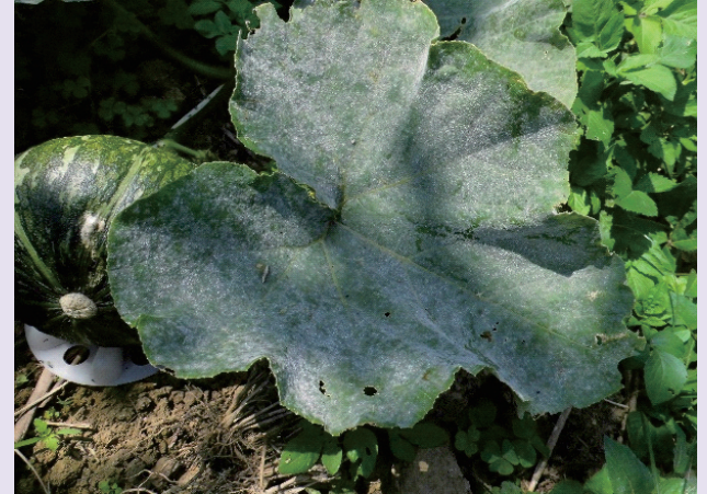
栗子南瓜白粉病葉上表皮覆蓋白色粉狀物

經過多數農友回饋及測試，便宜好用又配製容易之核准用藥為「可濕性硫磺粉劑」。硫磺為免定殘留容許藥劑，另有機友善栽培需經驗證單位核准方得使用，更無安全採收期疑慮，因可補充硫元素增強植株抗性、具微揮發薰蒸性卻無異味，及直接抑制病原菌生長等多重效用，相較於其他藥劑防治效果顯著持久，且不易讓病原有抗藥性，對銀葉粉蝨也具控制效果，惟需注意不要提高濃度或高溫下使用避免藥害。