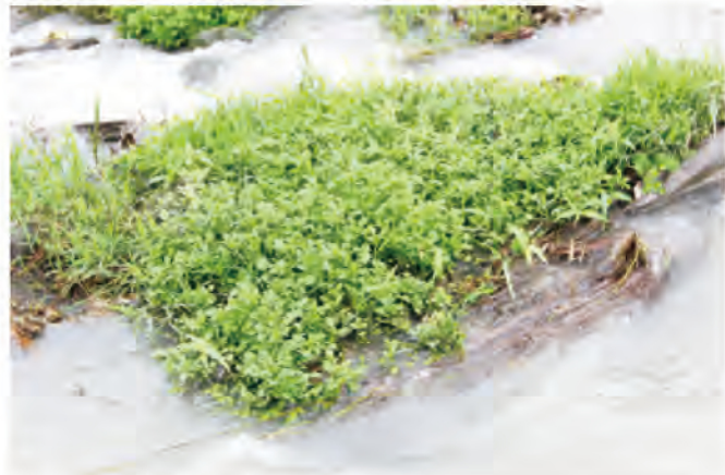
圖1. 生長於溪岸(左)及溪洲(右)的野生豆瓣菜族群