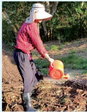
本場導入微生物菌種及堆肥技術，達到牧場內部資源循環效果