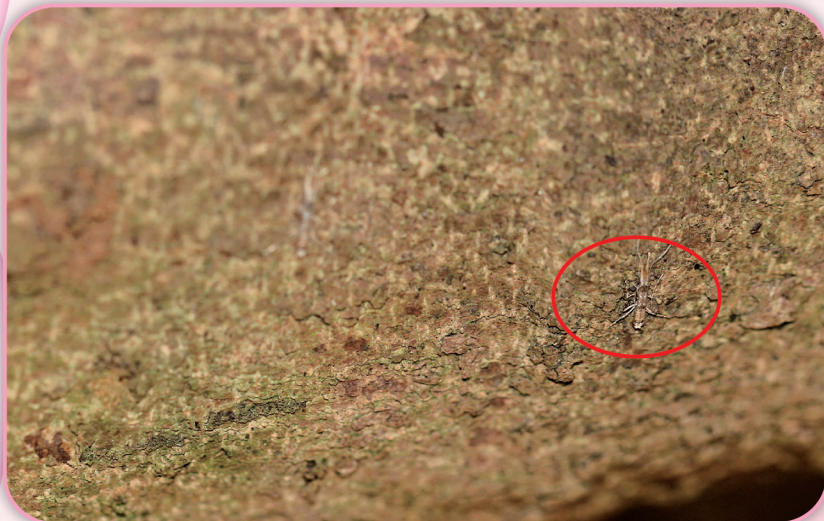
荔枝細蛾成蟲喜歡棲息於枝條下方

目前高屏地區的玉荷包荔枝花期已進入尾聲，喜歡取食荔枝果實的「蒂頭仔蟲」（荔枝細蛾），在荔枝果實綠豆大時就會在果皮上產卵，孵化後的幼蟲隨即蛀入果實內危害，本場提醒農友－此時為重要的防治時機。由於成蟲喜歡棲息在枝條下方，所以噴藥時應加強樹冠內的枝條噴灑，並自荔枝小果期就要注意防治，避免害蟲數量遽增而影響荔枝收成。