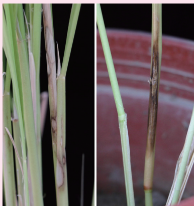
▲ 左為人工接種後之典型水稻紋枯病菌之斑紋病徵，右為人工接種小粒菌核病之黑褐化病徵