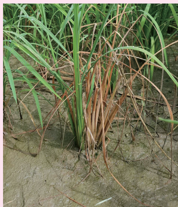
▲ 為南投縣仁愛鄉發生之水稻小粒菌核病之病株，可見數株分蘗株已經褐化死亡